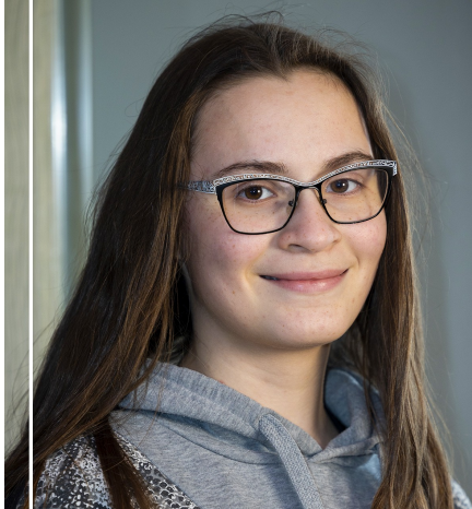
Absolventka 1. stupně Taneční obor