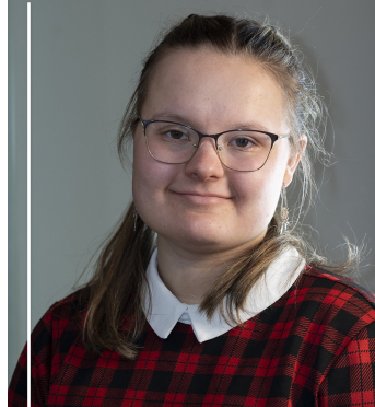
Absolventka 2. stupně Hudební obor - Klavír