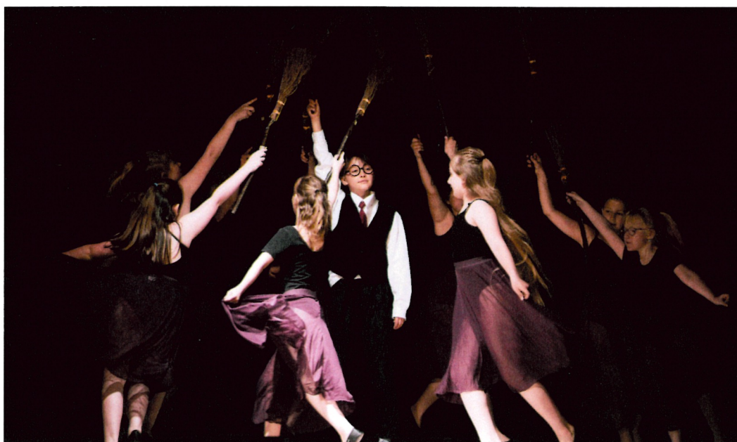
Harry Potter – 3. - 4. ročník