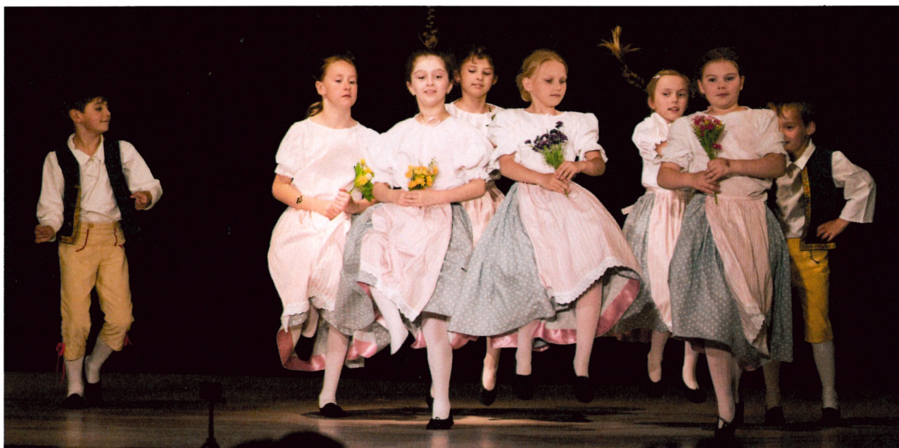
Chodila jsem na modráčích – 1. + 2. ročník „B“