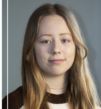
Absolventka 1. stupně Hudební obor - Klavír