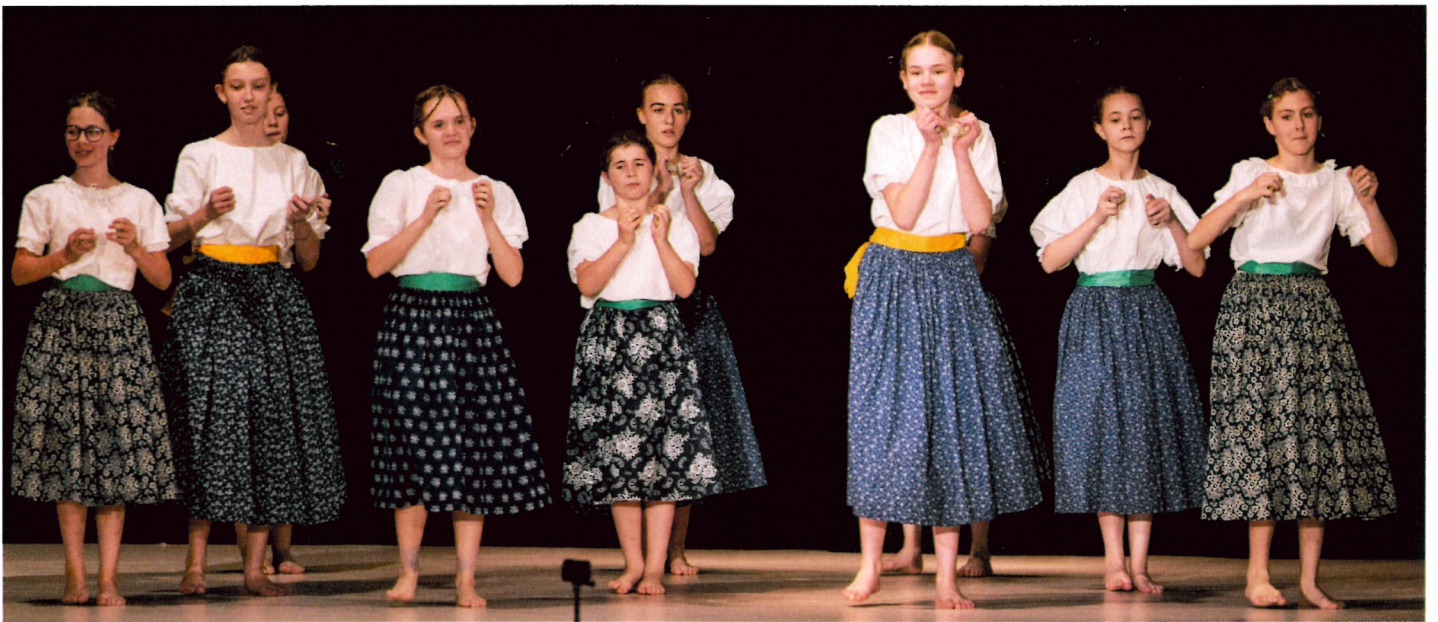
Na řečickém rynku – 4. + 5. ročník