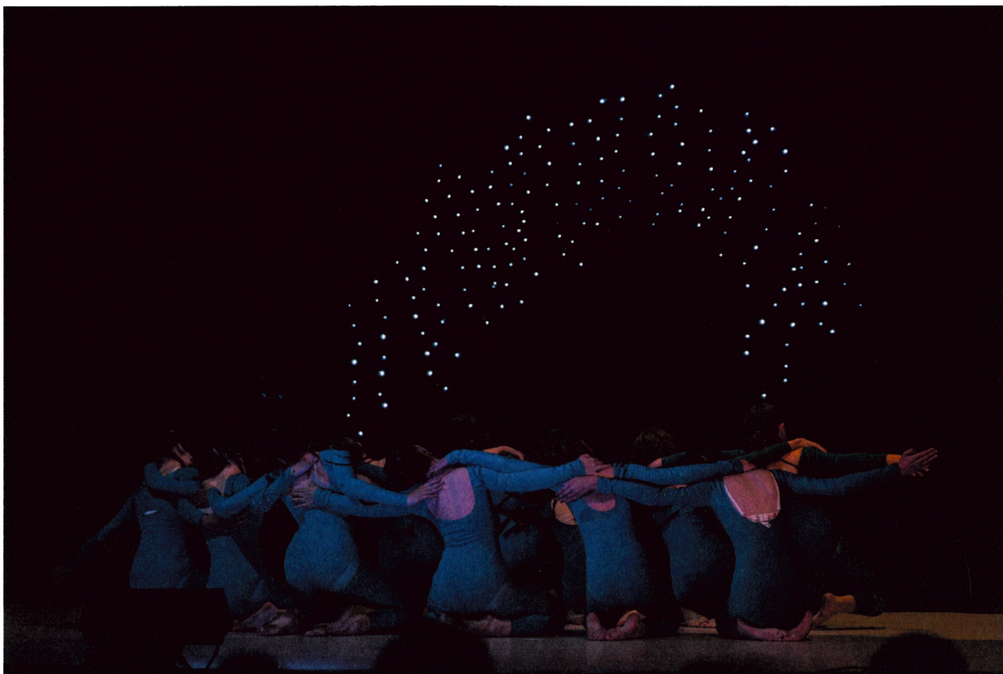
Avatar – 4. + 5. ročník