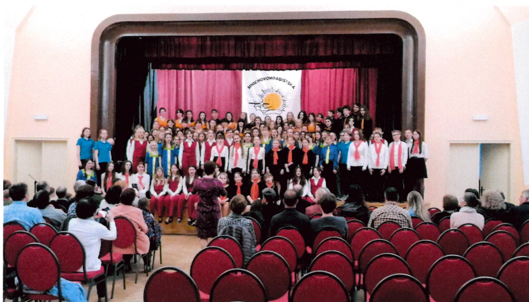
společná závěrečná píseň