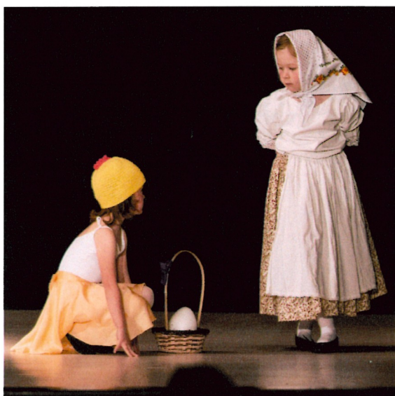
Babička a slepička – Přípravný ročník