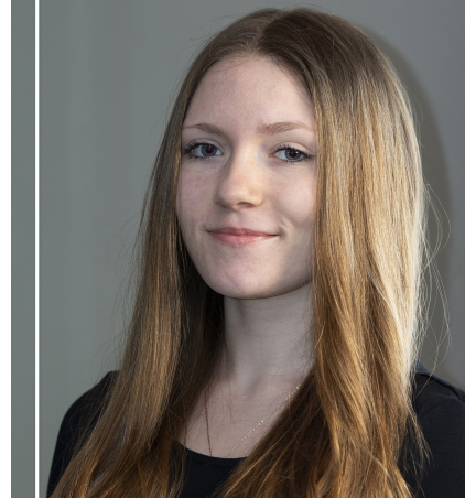
Absolventka 1. stupně Hudební obor - Saxofon