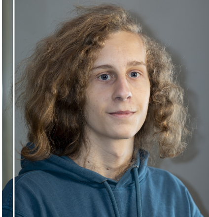
Absolvent 1. stupně Hudební obor - Kytara