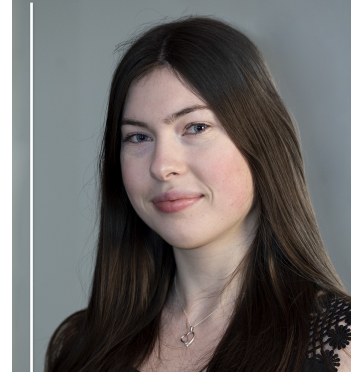
Absolventka 2. stupně Hudební obor - Klavír