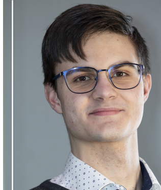
Absolvent 2. stupně Hudební obor - Zpěv, Klavír