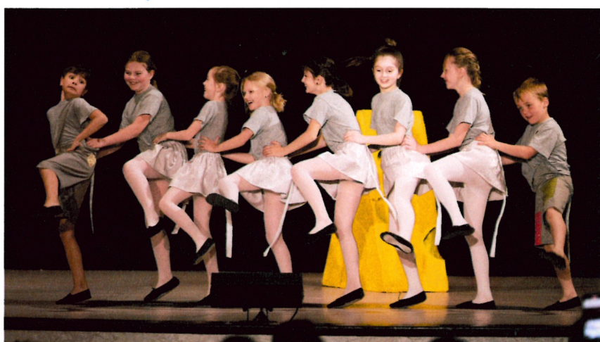
Kus sýra – 1. + 2. ročník „B“