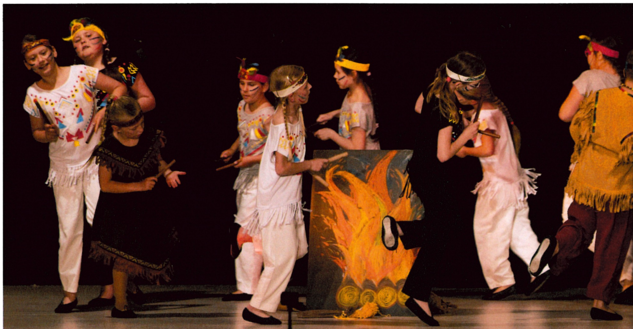
Setkání u ohně – 1. + 2. ročník „A“