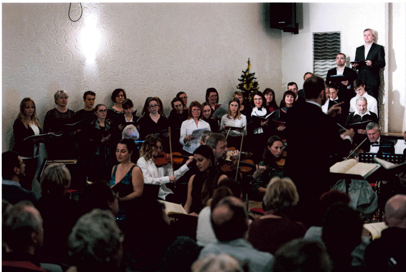
pěvecký sbor a složený z žáků, učitelů ZUŠ a občanů města Benátky n/J