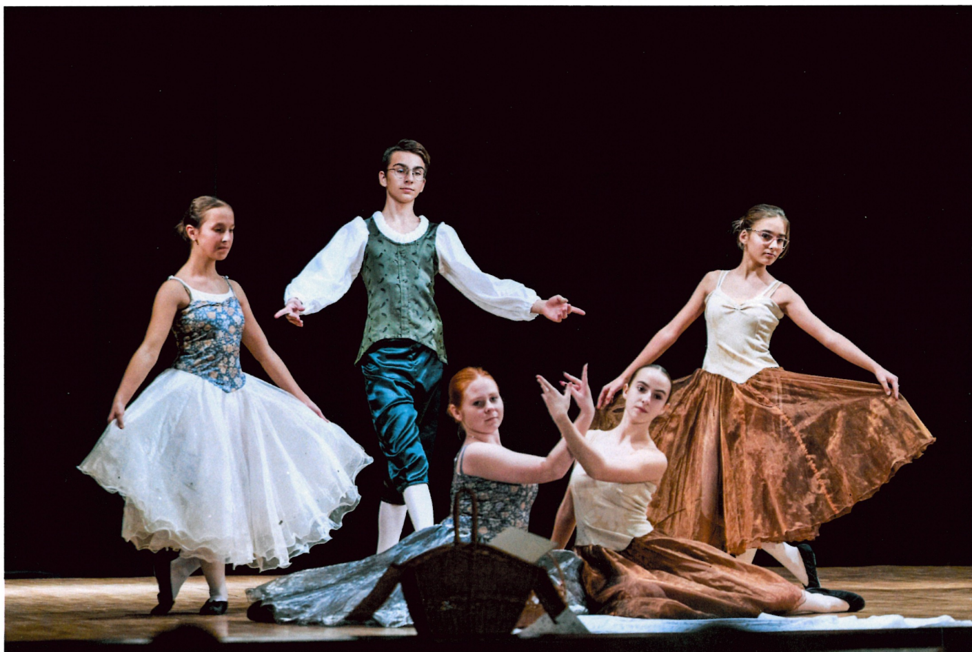
žáci tanečního oboru 6 – 7. ročník