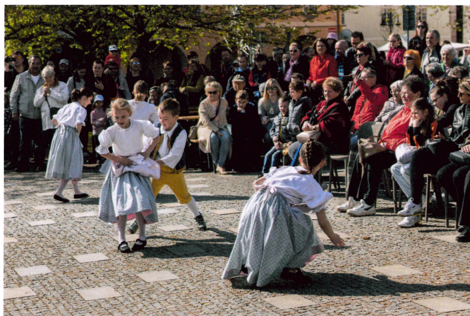
„Chodila jsem na modráčích“ 1. + 2. ročník „B“