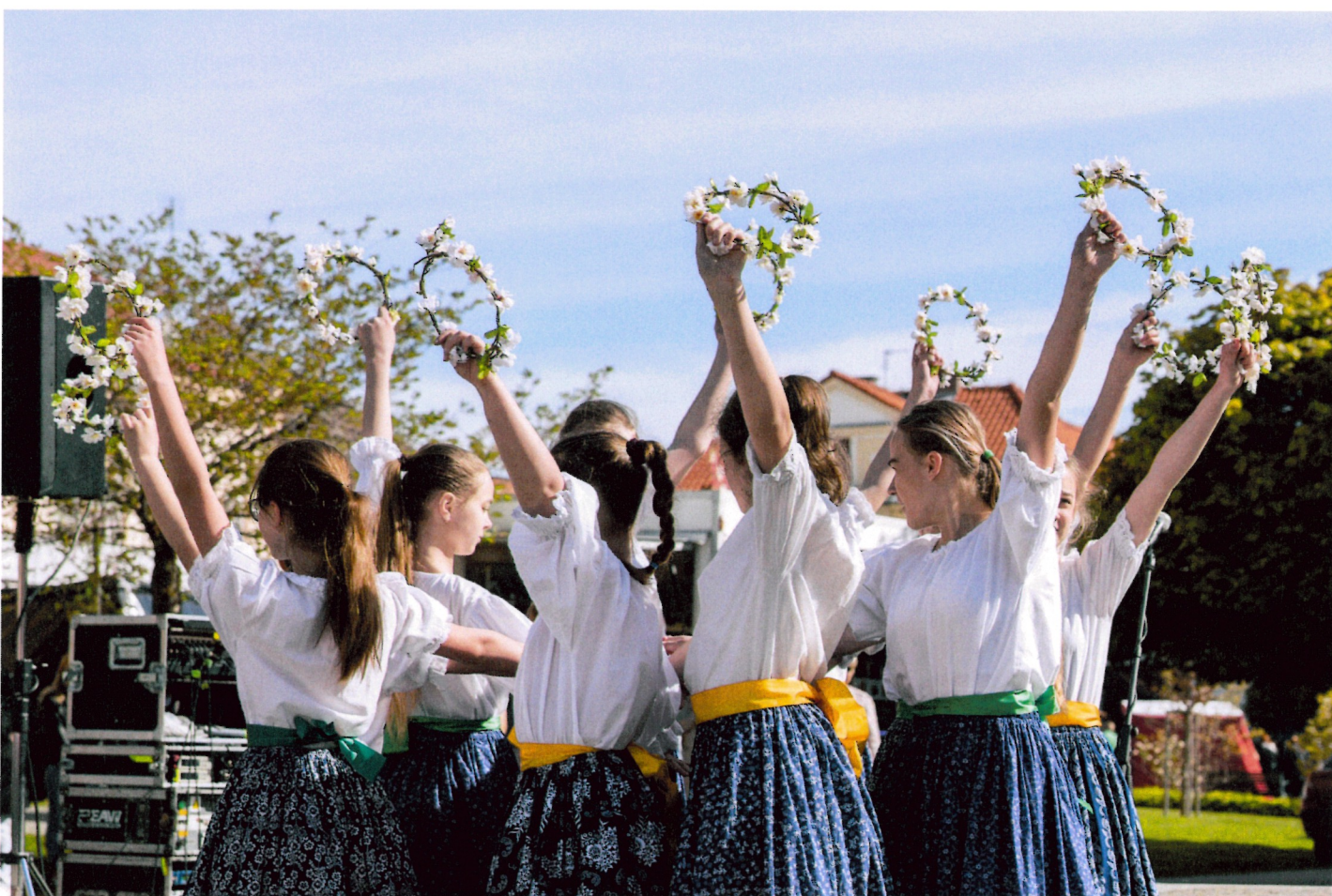
„Sulislavský kostelíčku“ - 4. + 5. ročník