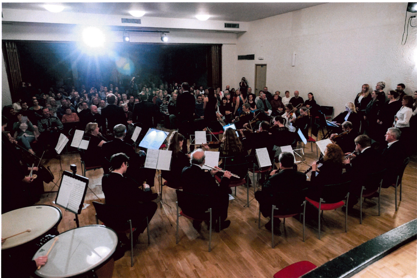
závěrečnou koledu Narodil se Kristus Pán zpíval celý sál