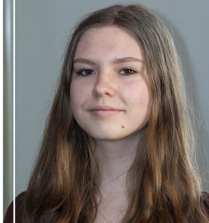
Absolventka 1. stupně Výtvarný obor