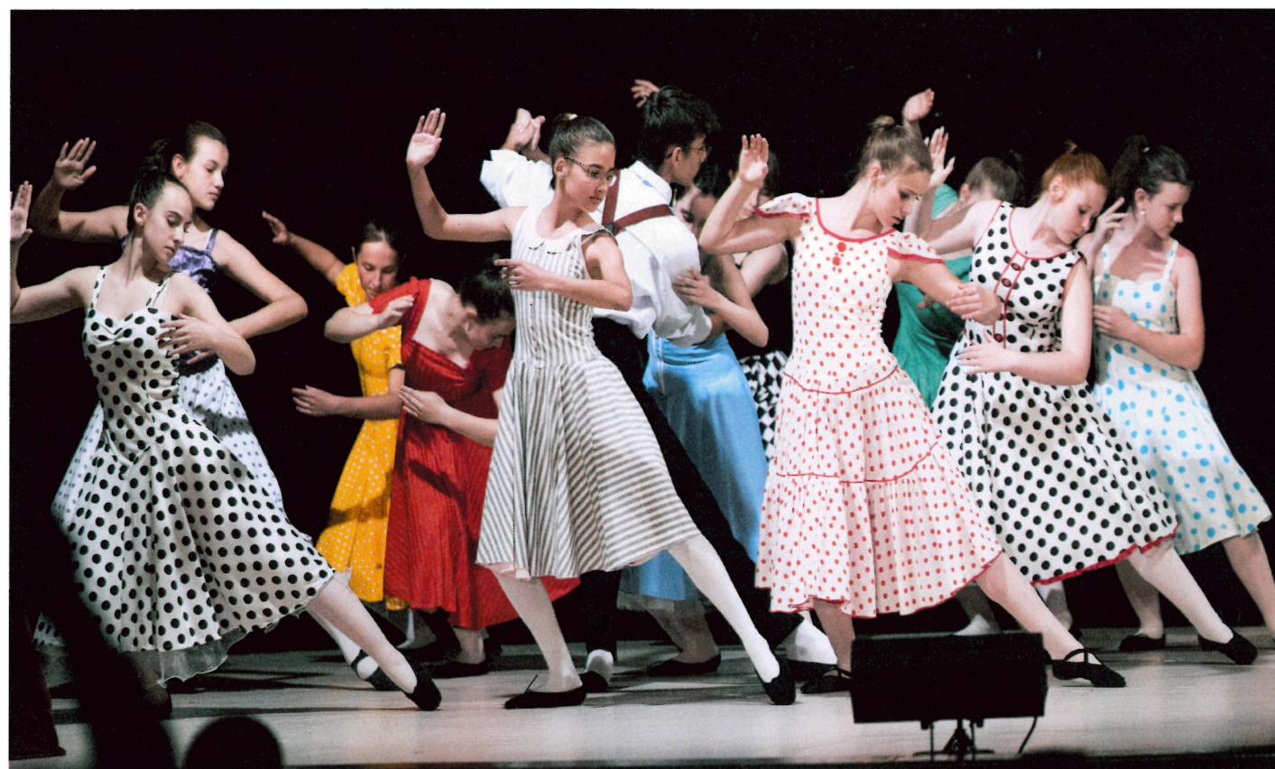
Maturitní ples – 6. - II. ročník