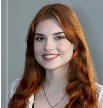
Absolventka 2. stupně Hudební obor - Zpěv