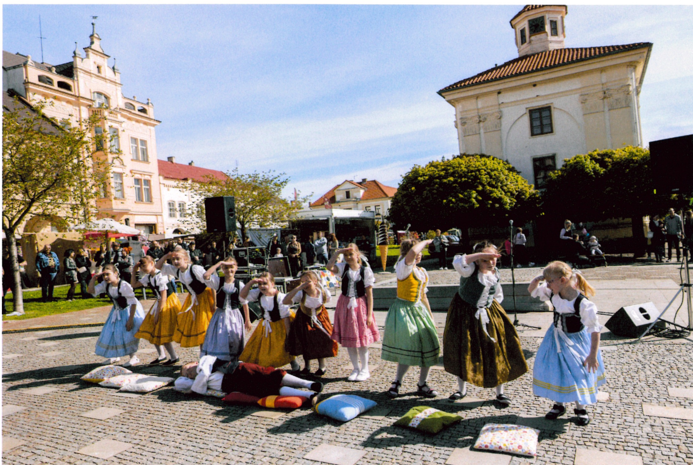
„Nefoukej, větříčku“ - 3. + 4. ročník