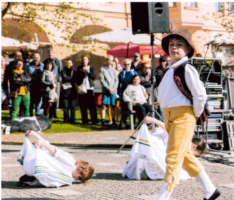
„Letěla husička“ 1. + 2. ročník „A“