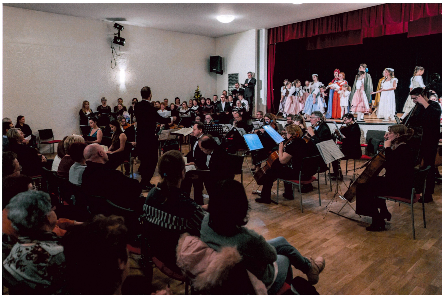
v orchestru hráli členové Komorního orchestru Mladá Boleslav a učitelé ZUŠ