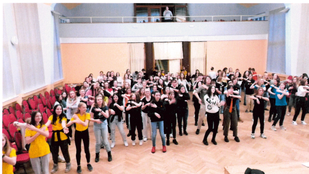
závěrečná After party