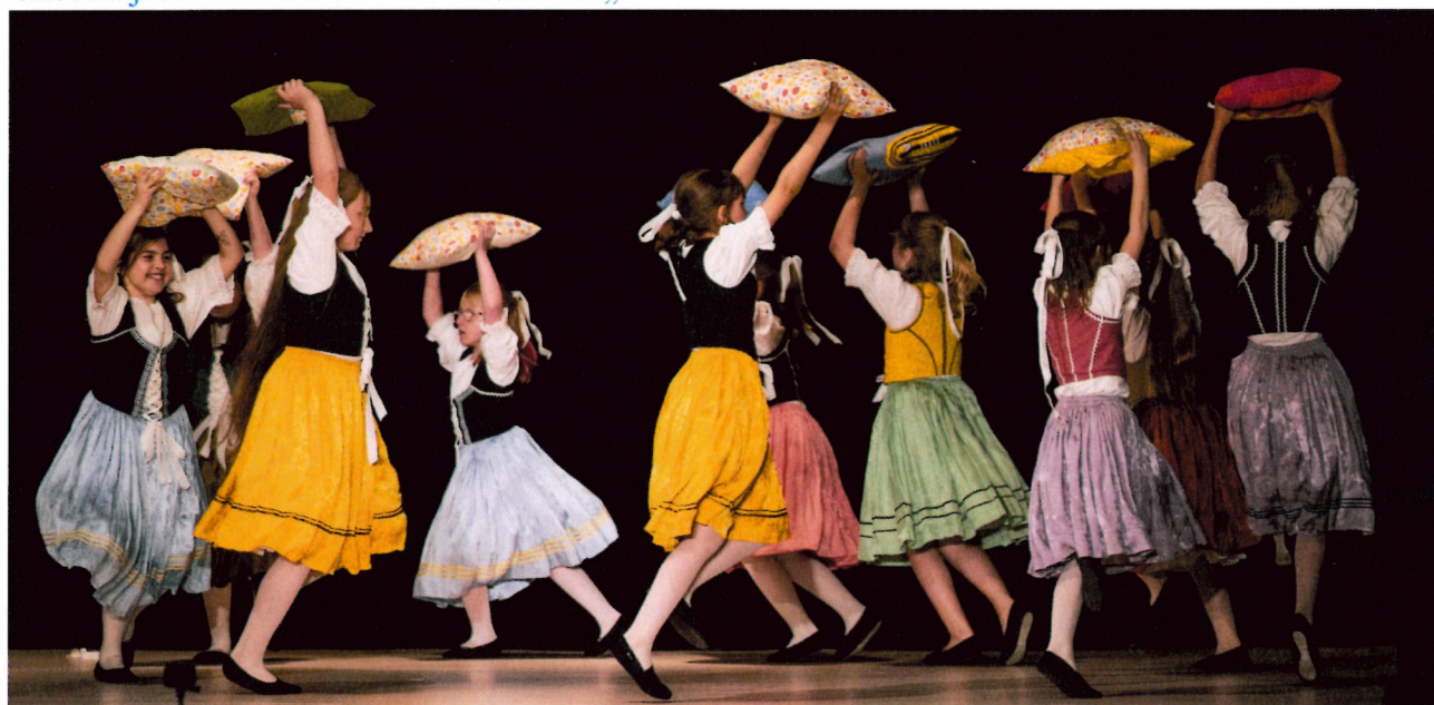
Nefoukej, větříčku – 3. + 4. ročník