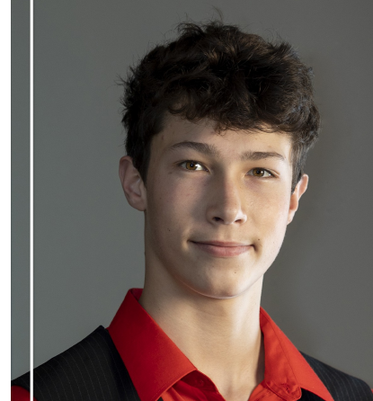
Absolvent 1. stupně Hudební obor - Kytara