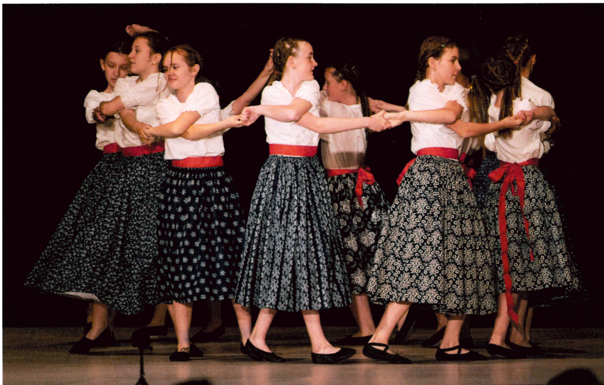
Slovanský tanec č. 2 e moll – 4. + 5. ročník